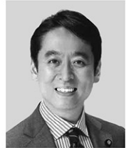
平木 だいさく 現 役職：元経済産業大臣政務官。 参議院議員1期。 経歴：東京大学法学部卒。 年齢：44歳 未来をひらく 確かな実力!