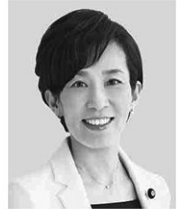
山本 かなえ 現 役職：元厚生労働副大臣。 参議院議員3期。 経歴：京都大学文学部卒。 年齢：48歳 「あなたの声を、かなえるチカラ。」