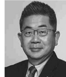
党書記局長 小池 晃 現 59歳。参院議員3期。全国革新党代表世話人。医師。 活動地域 東京