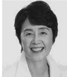
党農林・漁民局長 紙 智子 現 64歳。参院議員3期。 活動地域 北海道、東北