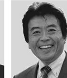
弁護士 仁比そうへい 現 55歳。参院議員2期。党参院国対副委員長。 活動地域 中国、四国、九州・沖縄