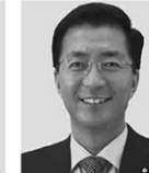
党副委員長 山下よしき 現 59歳。参院議員3期。 活動地域 大坂、兵庫、道賀、奈良、和歌山