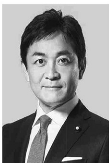
国民民主党 代表 玉木雄一郎