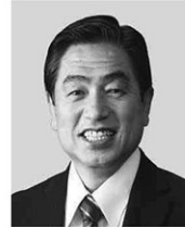
若松 かねしげ 現 役職：元復興大臣、参議院議員1期。 経歴：中央大学2部卒、公認会計士。 税理士、行政書士。 年齢：63歳 「現場第一」で復興・防災に全力