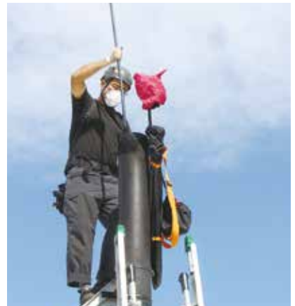
薪ストーブを安全で快適に使用するために掃除は不可欠

薪ストーブにはメンテナンスとアドバイスが不可欠なのが、付けっ放しで、メンテナンス