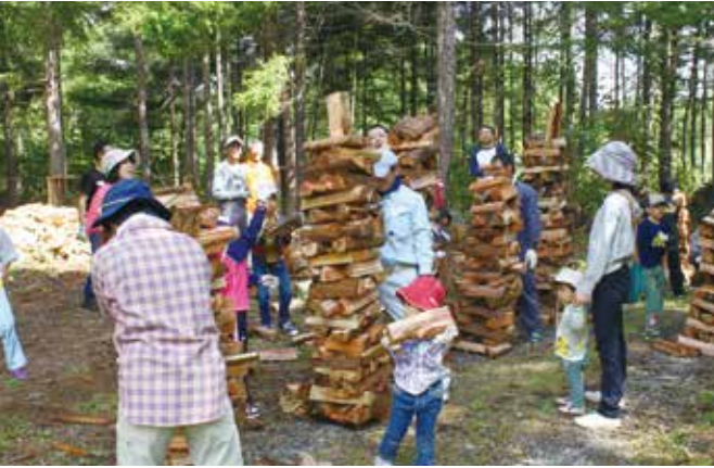
13家族が参加して交流した「薪祭り」

山で開かれた。自宅に薪ストーブを設置している13家族が参加、薪高積み選手権や薪丸太投げ、薪積みアート、丸太に輪投げ、の5種目に、パパの部、ママの部、お子さんの部に分かれて挑戦した。