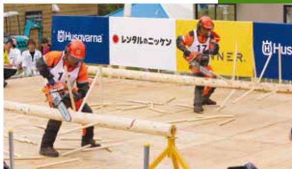
枝に見立てた丸棒を切り落とす「枝払い」

大会は、「伐倒」「ソーチェーン丸太輪切り」「枝払い」の5種目で実施。丸太を切る際のミリ単位での正確性や速さ、安全に対する意識などを採点で審査した。2日目に行われた最後の競技となる「枝払い」では、その得点によって日本代表が決まるため、選手の表情には緊張が見られた。スタートの合図で、枝に見立てた丸棒が突き出る丸太に近づき、丸棒を切り落としていく。見事なチェーンソー捌きに観客から拍手が沸いた。