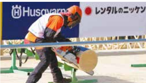
「丸太合せ輪切り」。上下の切り口を合わせることが鍵

世界大会は40年以上の歴史を持ち、約30か国、100人超が参加している。近年は隔年で開催し、今年はスイスで行われる。日本大会は、全国森林組合連合会などをつくる実行委員会が主催。同連合会が世界大会の日本事務局として認定されたため日本大会を開催できるように