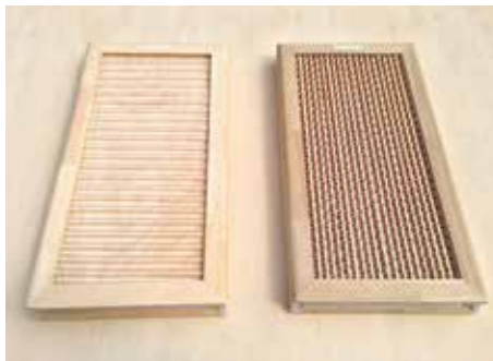
「e・wood+」で作られた「猫の爪とぎ」(左)と「パーテーション」

長は「第8回国際雑貨EXPO」と「インテリア・ライフ・スタイル展」にも出展、産業交流展で面識を得ていた関係者たちがそこにも訪れ、共に「e・wo