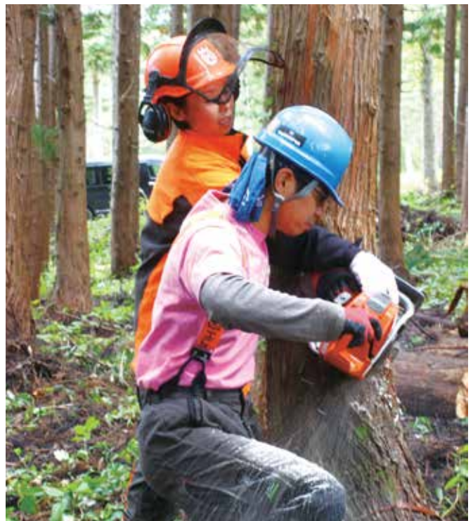
真剣な面持ちでチェーンソーの実習に取り組む

県内外から参加した受講生は18人。このうち女性は5人で、回を重ねるごとに女性が増え、増えている。大学生の兄と一緒に参加した高校2年生の女子は、「将来、林業に進むかどうか