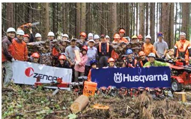
自伐林業に意欲を燃やす

主自ら木をチェンソーで伐採し、搬出し、販売する小規模な林業スタイルが自伐林業方式。一人でも始められ、大がかりな林業機械を導入しなくても良いため低コスト。必要なのは林業技術を学べる講座だが、青森県では少ないため、同協議会が率先して昨年第1回「実践的キコリ養成講座」を開催した。「ペレットの原料となる木材を、自伐林業方式で仕入れ、ペレットストーブやペレットボイラーの燃料として供給する。地域に必要な燃料を地域で作って出して供給する」エネルギー独立共和国「実現への活動を発信していきたい」