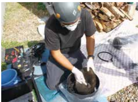
煙突のトップに付着したススやタールを入念に落とす