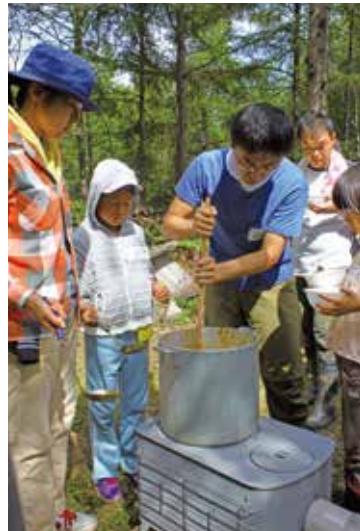
昼食のカレーライスを薪ストーブで煮込む