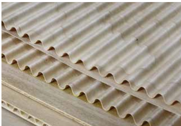
素材が木だけに軽量、丈夫さが大きな特徴

一方、2013年には、地域 資源である木を活用した新商 品開発の事業が、国の「地域産 業資源活用事業計画認定」を