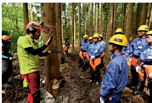
【伐採技術の説明を真剣に聞く高校生】