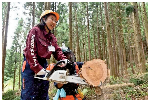
【チェーンソーで実際に丸太を切断】