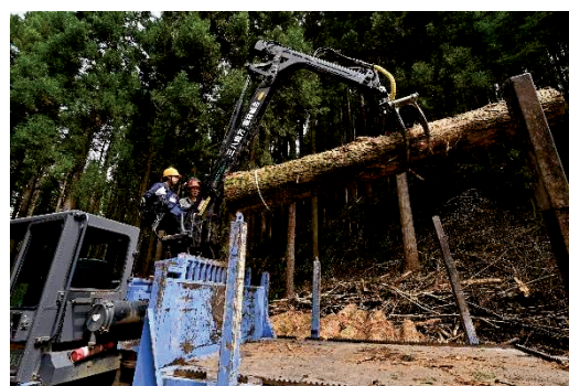
【高性能林業機械の操作体験の様子】

参加者は、林業の現場が想像以上に機械化されている様子に驚きながら、「学校でロボット製作に携わっているので、林業でも何か役立てるかもしれない」と感想を述べていました。