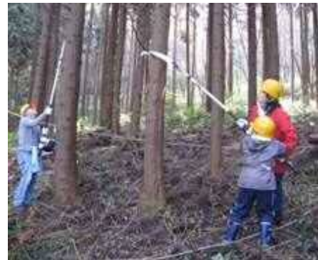
【枝打ち作業を体験する様子】

自然観察や野外活動のためのフィールド提供や、企業やボランティア等による森林整備活動の受入れなど多面的な活用を進めます。