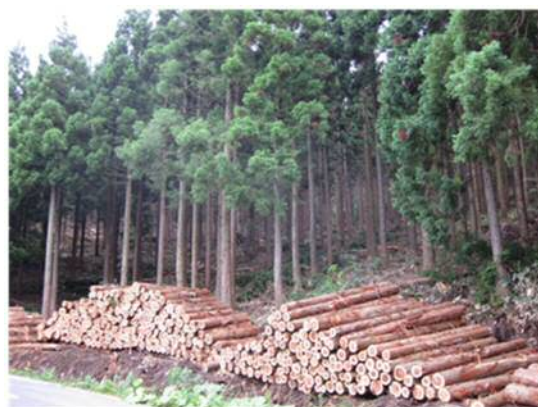
【階上町の契約地における利用間伐】

また、集材距離を短くするための路網整備や、作業の低コスト化が可能な性能の高い林業機械を導入し木材販売収益の向上を併せて進めます。