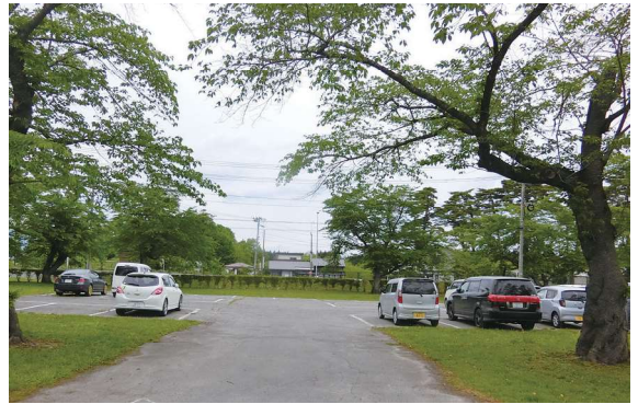
近隣の学生は通学も可能