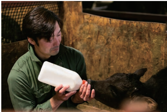
生後1か月の牛に哺乳