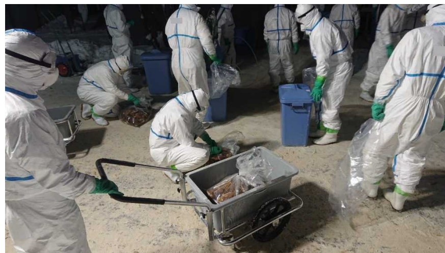
②2022. 12. 20 (5時頃) 防疫作業の様子2 (リヤカー活用)