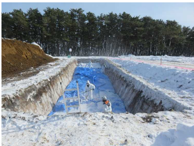
③2022. 12. 19 (10時頃) 埋却溝の状況 (石灰散布)