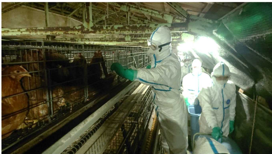
①2022. 12. 20 (5時頃) 防疫作業の様子1