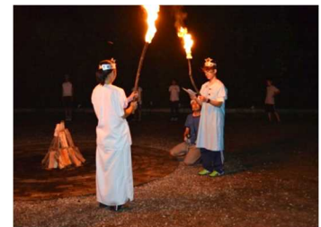
<トーチサービスの様子>

自然の中で火を囲み、儀式、歌、踊り等を行います。プログラムは団体の実情に応じて様々にアレンジを加えることができます。ゲームやスタンプなど各グループで考えた出し物を組み込むことにより、仲間との協力や親睦を深める活動です。