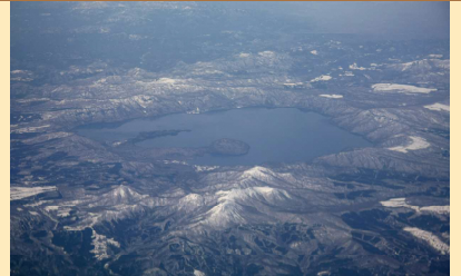
十和田全景 東側上空から

※11月から4月は冬期閉鎖となる道路があるため、避難に時間を要することが想定されます。そのため、早めの行動が重要です。