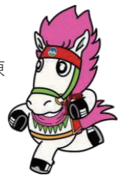
十和田市観光PRキャラクター 駒松くん