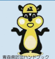
青森県防災ハンドブック 公式マスコットキャラクター おももリス