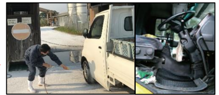
車両はタイヤだけでなく、 泥よけの内側まで消毒 し、 フロアマットの交換 や ペダル等車内も消毒