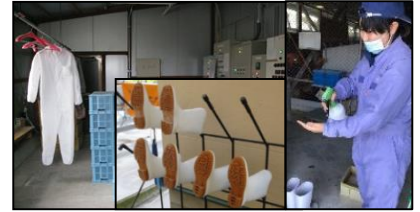
専用の服や靴の使用、手指消毒