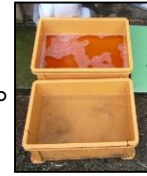
推奨される踏込消毒槽の設置方法！