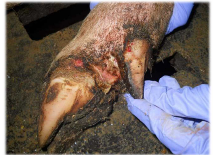
蹄球部皮膚のびらん