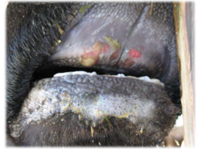
歯床部粘膜のびらん