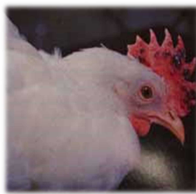
鶏冠・肉垂のチアノーゼ

〒035-0072 むつ市金谷2丁目 18-25 電話 0175-22-1254 FAX 0175-22-1259