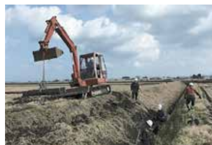
活動の様子（資源向上支払）

そこで、本交付金では地域の共同活動に係る支援を行い、農業・農村の有する多面的機能が今後とも適切に維持・発揮されるようにするとともに、担い手農家への農地集積という構造改革を後押しします。