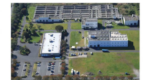
馬淵川浄化センター（八戸市）