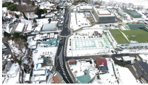
一般県道橋上名久井三戸線 平工区 道路改良事業（南部町）