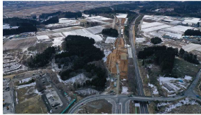
主要地方道八戸環状線 天久保工区 道路改良事業（八戸市）