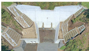
県道2号 雑草 遺棄砂の処理（三戸町）