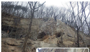
国道104号 道路尖岩防除工事（田子町）