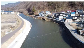
馬淵川(熊鷹川) 五城河川改修事業（三戸町）