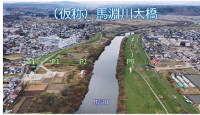
3-3号台八戸市川環状線 房内工区 街路事業（八戸市）