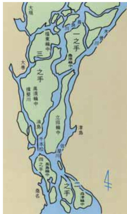
【宝暦治水時の木曾三川の様子】

しかし、それ以前の江戸時代には、人々にとって治水はある意味理不尽で過酷な側面もあったようです。