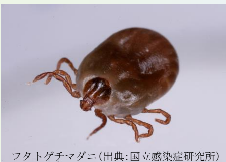
フタトゲチマダニ

感染症発生動向調査では、西日本の15県(近畿、中国、四国、九州地方)においてこれまで110人(男48、女62)のSFTS患者が報告されており、5月~8月の発症例が多いです(2015年4月8日現在)。国によるSFTSウイルス国内分布調査(2013年度)の結果、患者が報告されていない岩手県や北海道でもSFTS保有マダニが確認されました。青森県ではこれまでSFTS患者は報告されていませんが、マダニに咬まれないよう注意が必要です。主な予防対策は次の3点です。