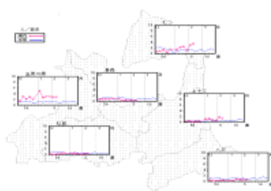
図2 保健所管内別流行性耳下腺炎報告数

本年の青森県における流行性耳下腺炎の定点当たり患者数は、全国より低く推移していますが、前年に比較すると、高い値となっています(図1)。保健所別では五所川原保健所管内とむつ保健所管内で多く報告されており(図2)、今後の動向に注意が必要です。