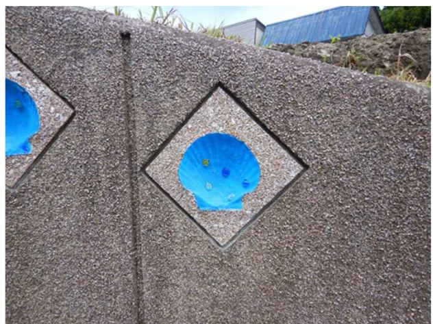
● 改善されたモニュメント