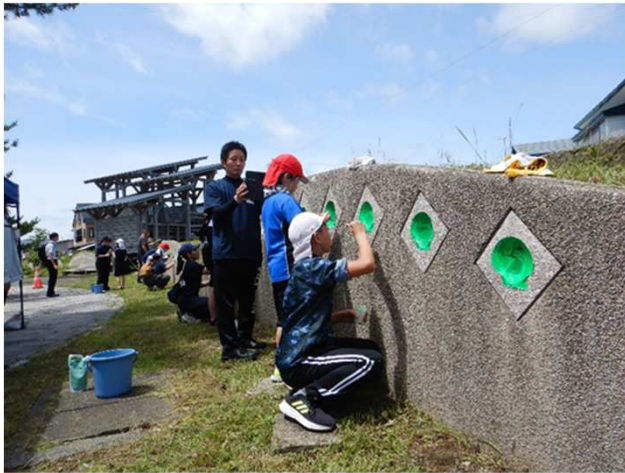
● 景観改善活動の様子