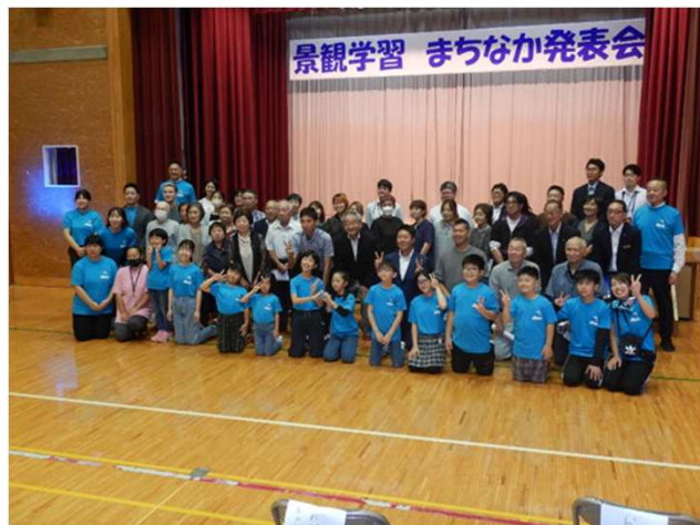
● 地域の皆さまにお集まりいただきました