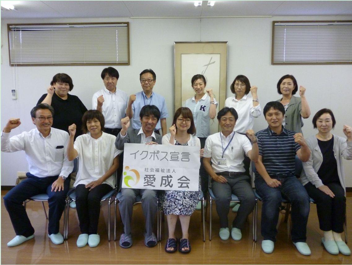
理事長&副理事長と法人各事業所の施設長たちによるイクボス宣言